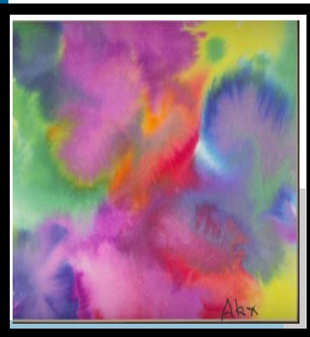
Artista: Alex Saag Donado por: La Institución VSA de Artes de la Florida en el Condado de Palm Beach

Los padres ayudándose mutuamente fomentan experiencias educativas y positivas para los niños, las familias y los educadores